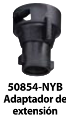
50854-NYB Adaptador de extensión